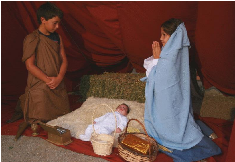
Crèche vivante avec des enfants syriens

En cette approche de Noël, prions pour les réfugiés chrétiens en Europe qui ne trouvent pas de toit. Certains d'entre eux se retrouvent même sans aide de l'Etat, pour peu qu'ils trouvent sur leur chemin ici une traductrice musulmane employée par l'Ofpra (qui traduit de sorte que leur dossier soit refusé), là un travailleur social musulman qui enterre leur dossier, ou même qui fait enlever leurs enfants et les placer dans une famille musulmane, etc.