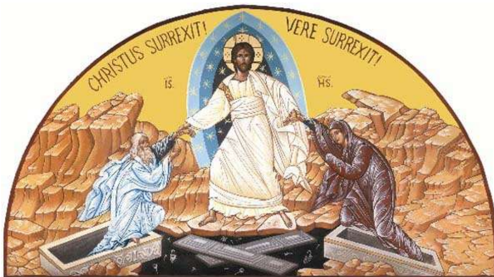
Christ est ressuscité, Il est vraiment ressuscité ! (21 avril /28 cal. orthodox.)