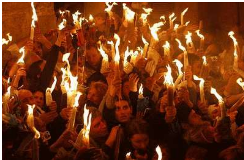
Que le feu sacré fortifie chacun dans le feu de la foi !